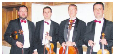
Das Reinhold-Quartett bürgt für Qualität.

In der 26. Saison gibt es acht Kammerkonzerte im Alten Pfarrhaus